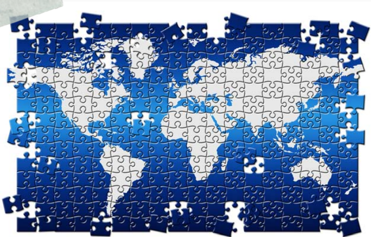
Jigsaw World