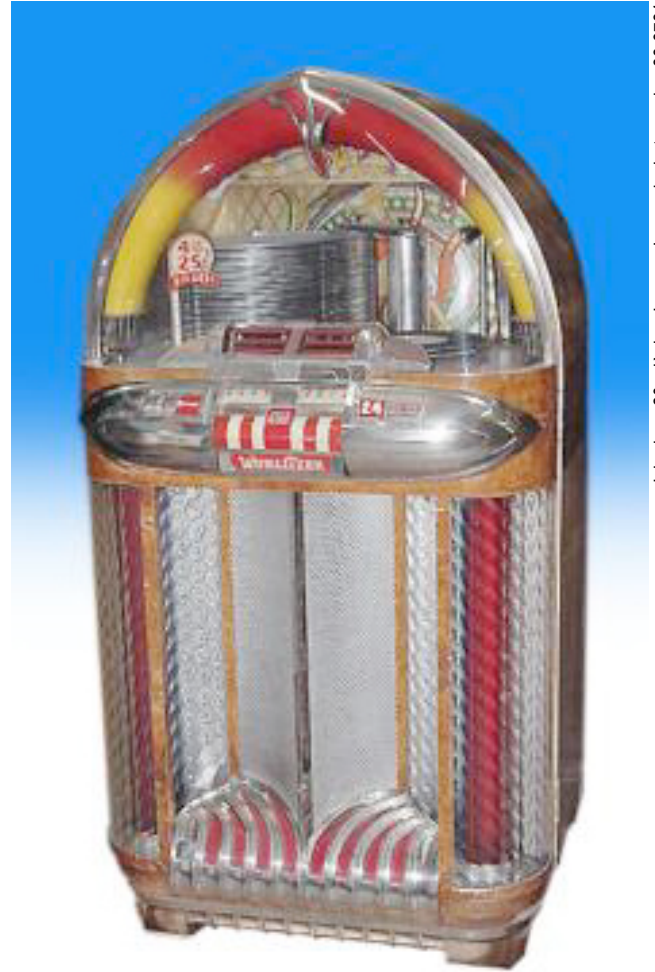
Juke-box, 20 e siècle, Jacques Lessard, photographie, 88-6784.

Mais revenons à nos moutons. Une fois ta pièce de monnaie insérée, tu peux choisir ta chanson. Tous les titres sont écrits, là devant toi. Tu n'as qu'à les lire jusqu'à ce que tu en trouves un à ton goût. Chaque chanson a son code : E-7, B-2 ou C-4. Tu vois ces boutons, au-dessus de « Wurlitzer »? Eh bien! tu n'as qu'à appuyer sur celui qui correspond au disque de ton choix. C'est cela qui me fait savoir lequel je dois faire tourner.