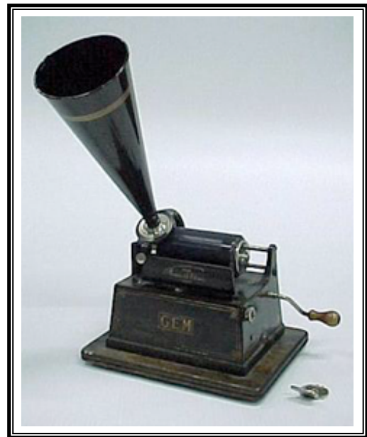
Phonographe, vers 1905, Musée de la civilisation, n°86-8622